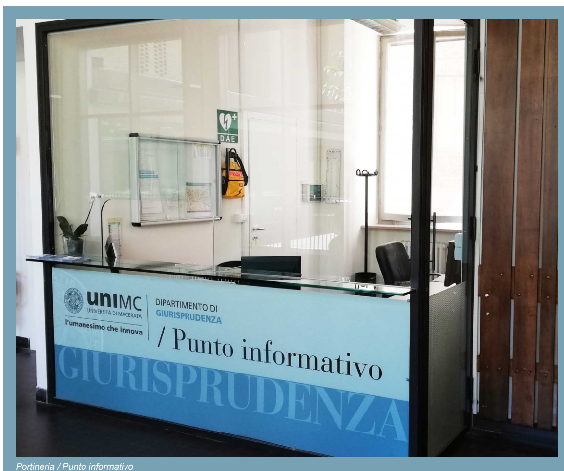
Portineria / Punto informativo