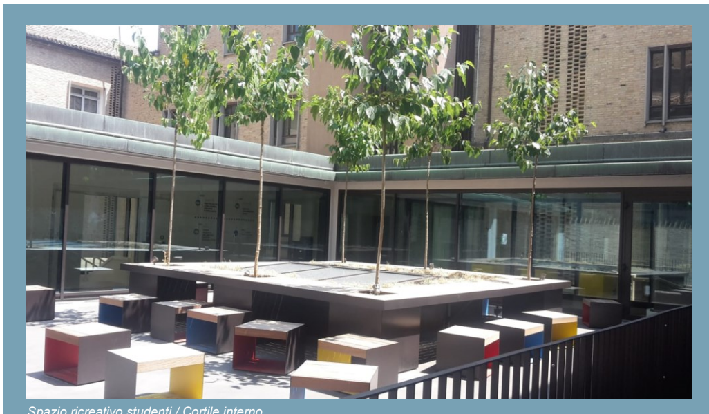
Spazio ricreativo studenti / Cortile interno