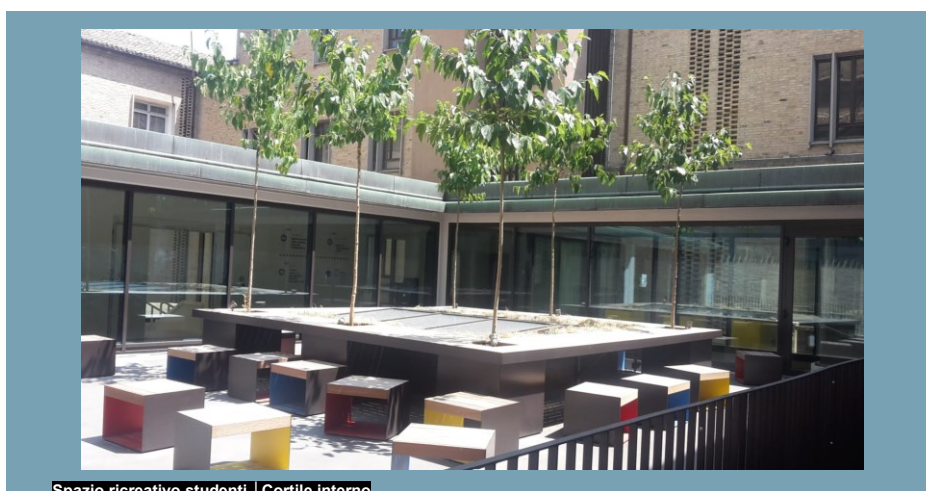
Spazio ricreativo studenti | Cortile interno