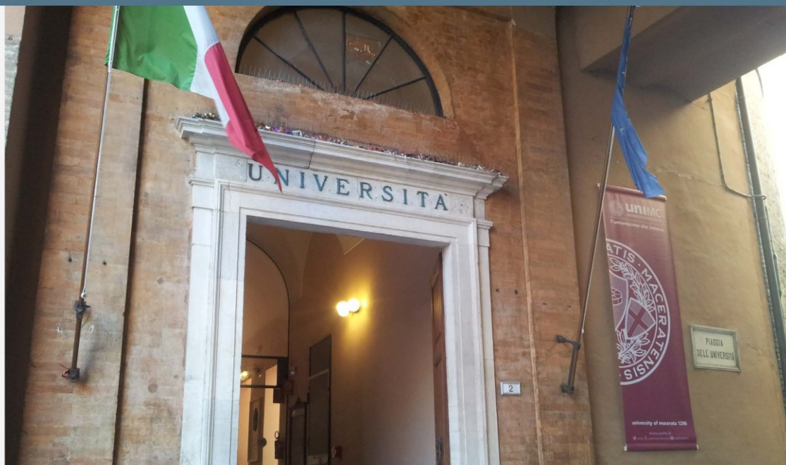
Giurisprudenza | Ingresso principale