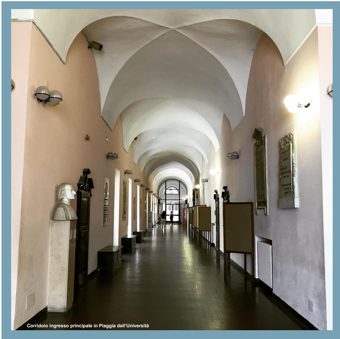
Corridoio ingresso principale in Piaggia dell'Università

con la redazione di un nuovo Statuto; numerose iniziative si susseguono con particolare attenzione al potenziamento della didattica; s'incrementano i corsi, si organizza l'Istituto di esercitazioni giuridiche; si crea la Scuola di perfezionamento in diritto agrario e in economia e statistica agraria. Nel secondo dopoguerra l'Università è attenta ad accrescere, in relazione alle emergenti esigenze, il proprio patrimonio di strutture didattiche e logistiche seguendo una concreta politica di scelte culturali di tipo umanistico nella prospettiva di ampliamento e potenziamento del rapporto Università territorio. Segno tangibile di tale politica, dopo la realizzazione negli anni sessanta della nuova Facoltà di Lettere e Filosofia, è stata la costituzione delle Facoltà di Scienze Politiche, Economia, Scienze della Comunicazione e Scienze della Formazione.