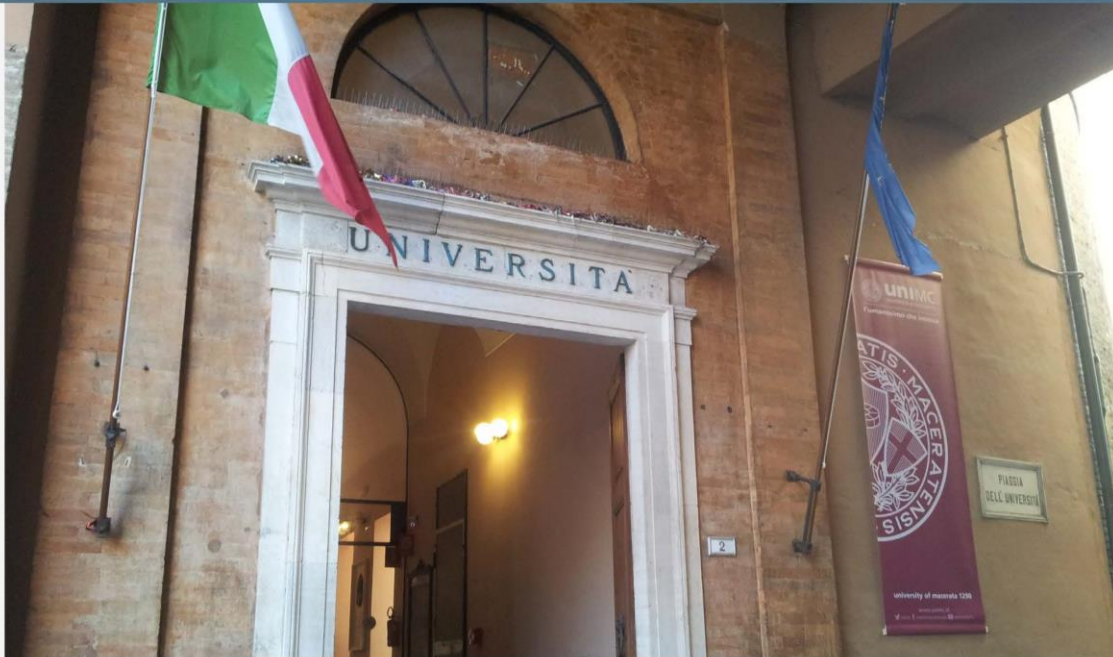
Giurisprudenza | Ingresso principale