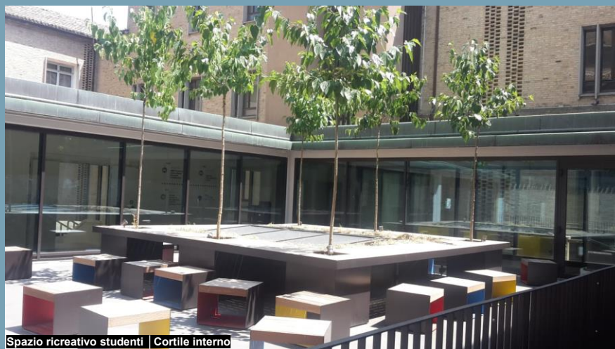
Spazio ricreativo studenti | Cortile interno