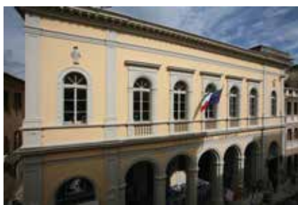
Sede di Jesi - Palazzo Ghislieri

martedì, giovedì e venerdì ore 9.00 - 13.00 lunedì e mercoledì ore 13.00 - 18.00